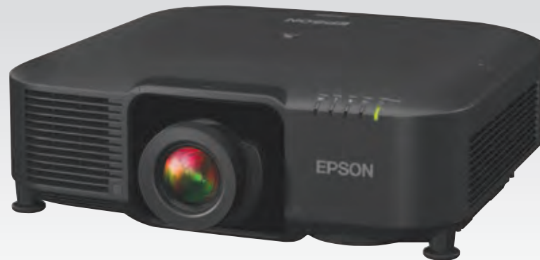
Producto mostrado con lente. La lente se vende por separado.