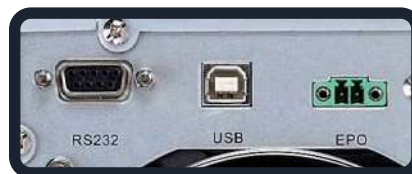
Puertos de comunicaciones externas / apagado de emergencia