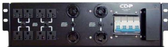
Compatible con unidad de distribución de energía (PDU) (se venden por separado)