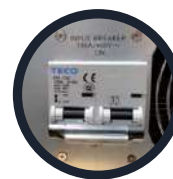
Breaker de entrada