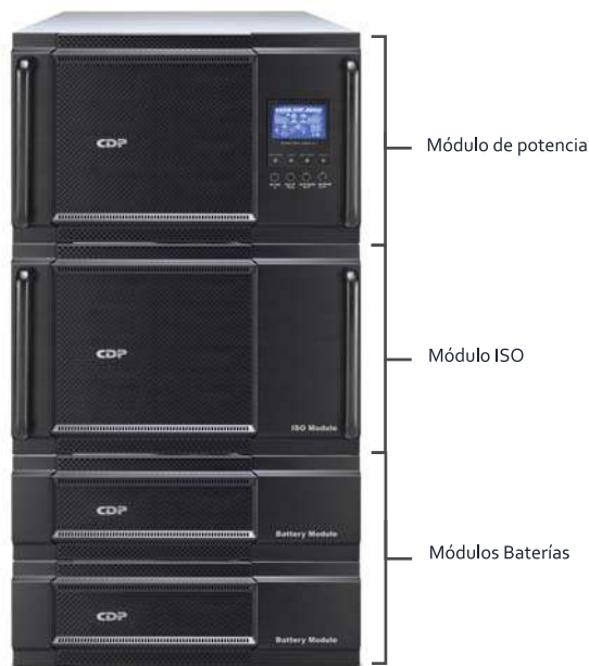
Módulo de potencia