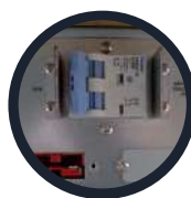
Breaker de baterías

· Tarjetas de comunicación de contacto para el monitoreo remoto.