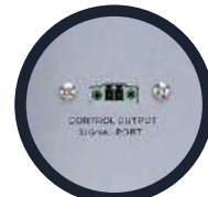
Puerto de control de salida