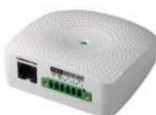
EMD (Dispositivo de monitoreo ambiental) para que pueda operar se necesita tener la SNMP instalada

· Módulos de potencia que pueden poner en paralelo con la misma capacidad de módulos de hasta 3 veces más un módulo para redundancia N + 1. Por ejemplo, 3 módulos de potencia de 20kVA en paralelo proporcionan 60 KVA, y un módulo 20kva adicional proporciona la redundancia N + 1.