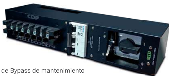
Conmutador de Bypass de mantenimiento (se venden por separado)